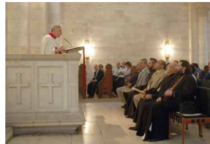
Bischof Dr. Munib A. Younan ist seit 1997 der dritte Bischof der Evangelisch-Lutherischen Kirche in Jordanien und im Heiligen Land mit Sitz in Jerusalem. 2010 wurde er zum Präsidenten des Lutherischen Weltbundes gewählt.